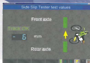
Contrôle du ripage Contrôle de la géométrie du véhicule avec interprétation