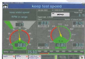
Contrôle antipollution Acquisition des émissions des gaz d'échappement pour une vitesse définie